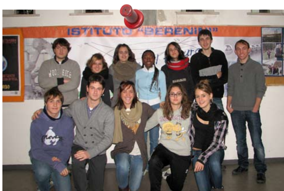
la Redazione de: "il Berenino"