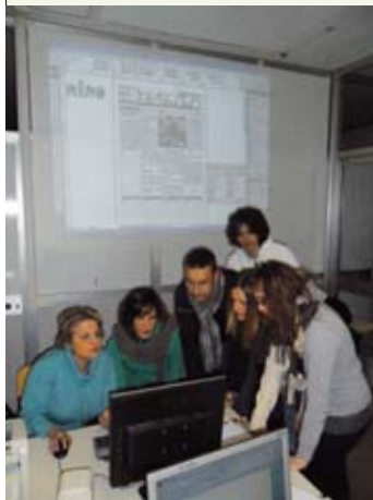
La Redazione al lavoro

Il motivo alla base della nostra partecipazione alla stesura del giornalino scolastico è la passione per la scrittura, la voglia di interagire con altri studenti e far conoscere con questa breve pubblicazione gli avvenimenti più importanti della scuola. Saremo grati a tutti i nostri compagni che vorranno contribuire alla stesura del giornalino, con notizie e argomenti che a loro possono interessare.